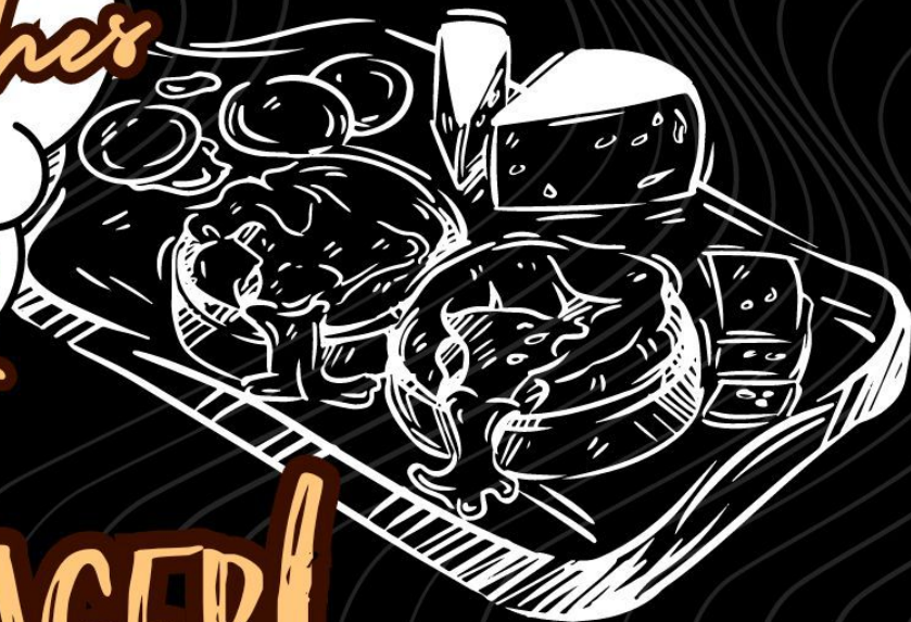
Planche Fraicheur MELON/JAMBON, LÉGUMES CROQUANTS, TOMATES MOZZA, BILLES DE CHÈVRE ET BETTERAVE